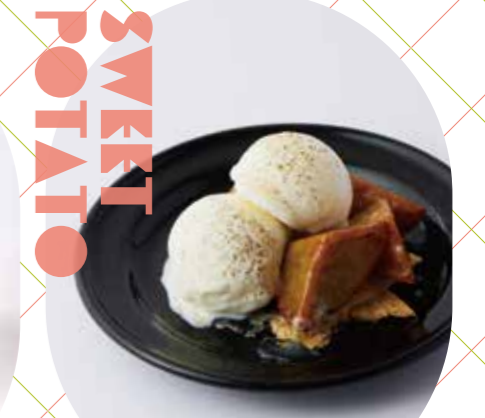
大学芋とバニラアイス ハニー&シナモン