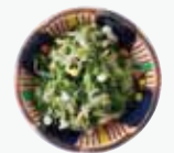
生青のりしらすごはん fresh green laver & whitebait + ¥300