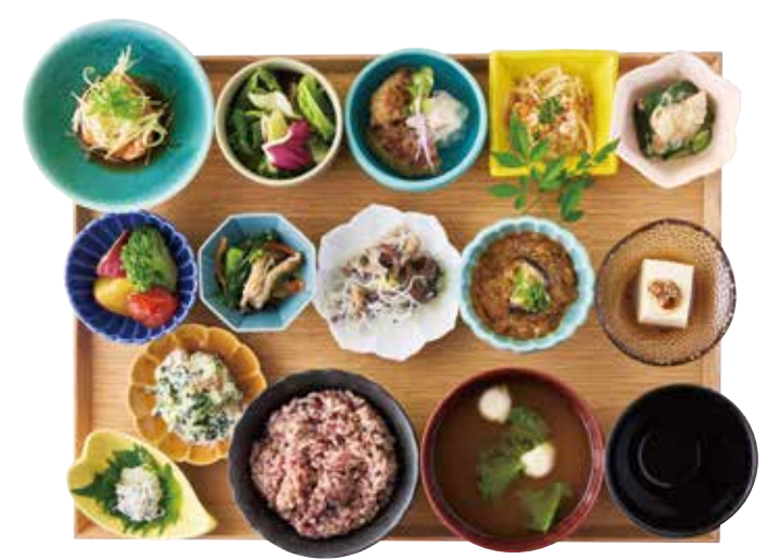
一汁十二菜膳 12 side dishes with rice and miso soup set ¥2,700