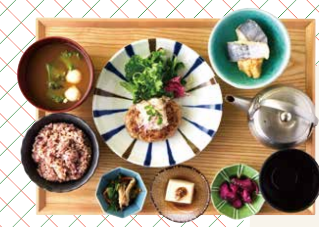
梅おろしハンバーグ × さわら Hamburg steak with plum and grated radish & Spanish mackerel