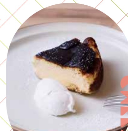
バスクチーズケーキ