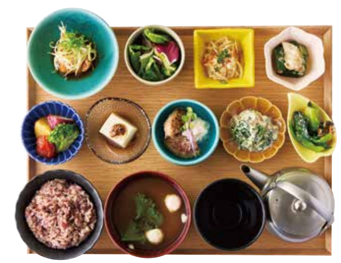
一汁九菜御膳 9 side dishes with rice and miso soup set ¥2,300