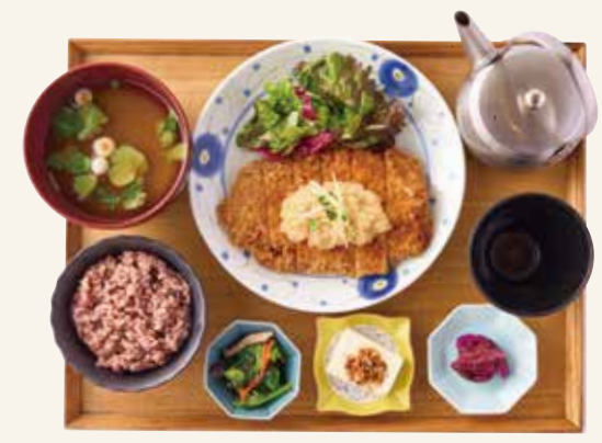
チキンカツたっぷりおろしポン酢 Chicken cutlet with grated radish and ponzu sauce ¥1,900