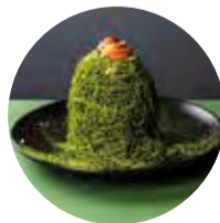
抹茶モンブラン 1,500 (1,650)