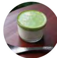
抹茶 プリン 700 (770)