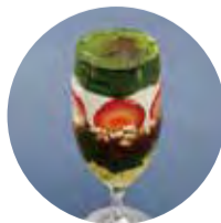
抹茶の ブリュレ仕立てパフェ 1,500 (1,650)