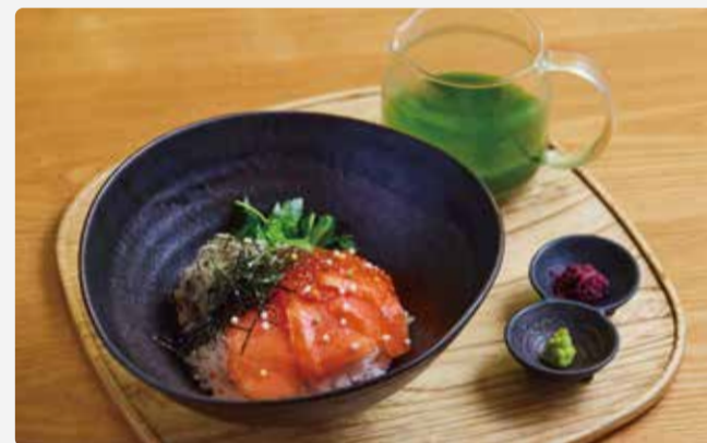
抹茶茶漬け 鮭といくら 本日の宇治茶付き

お抹茶の程よい渋みと香り豊かなお出汁が合わさり、 きりっとした爽やかさとなります。 ひと味変わったお茶漬けをどうぞ。 セット内容：茶漬け / 香の物 / 薬味