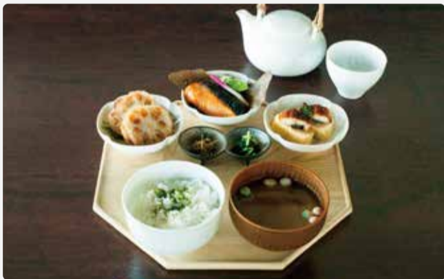
おばんざい小鉢 3 つ [えらべる主菜小鉢 1 つと小鉢 2 つ] 本日の宇治茶付き

CHA KAISEKI ZEN SET / 3 SIDE DISHES, RICE, SOUP AND UJI TEA