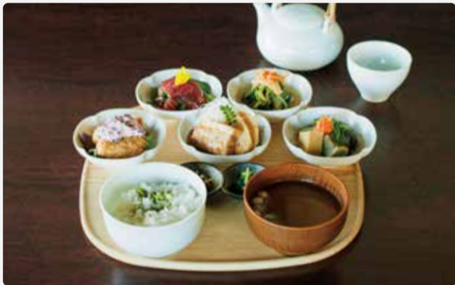
おばんざい小鉢 5 つ [えらべる主菜小鉢 1 つと小鉢 4 つ] 本日の宇治茶付き

セット内容：おばんざい小鉢 / 抹茶塩ごはん / 赤出汁 / 香の物 / 本日の宇治茶