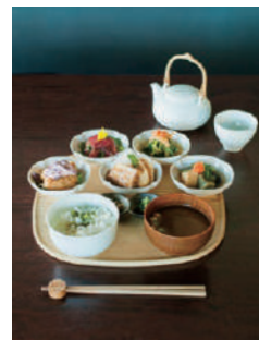
(写真はおばんざい小鉢5つのお茶懐石膳です)

ALL PRICES IN PARENTHESES INCLUDE TAX. THE PICTURE IS ONLY FOR REFERENCE. ( )内が税込価格です。写真はイメージです。