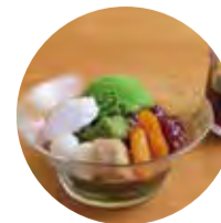
抹茶と京生麩の 冷やしぜんざい 1,000 (1,100)