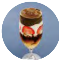
ほうじ茶の ブリュレ仕立てパフェ 1,500 (1,650)