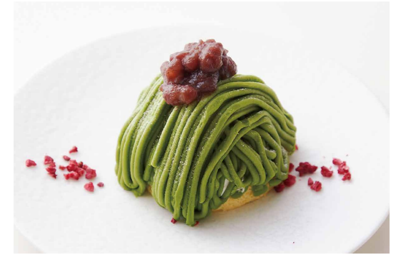
栗と抹茶のモンブラン