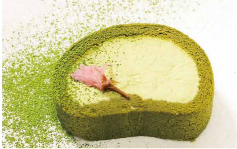
宇治抹茶のスフレロール