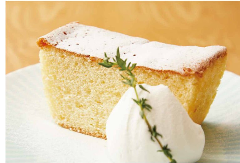
バニラみるくシフォン