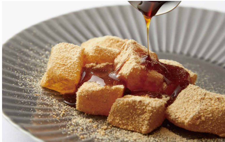
黒蜜ときなこのわらびもち