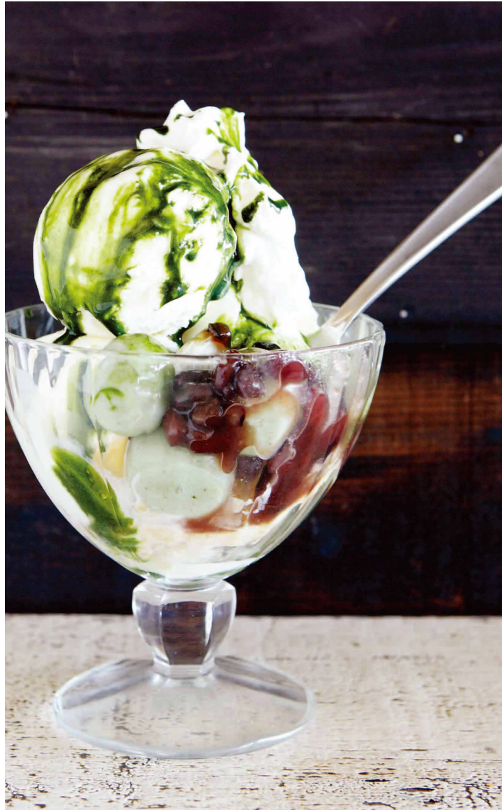
抹茶とココナッツのパフェ