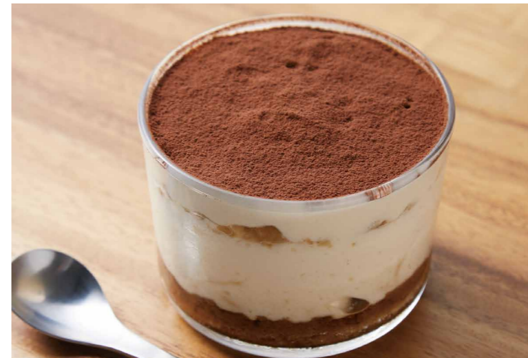
yusoshi こだわりのティラミス

福岡八女（やめ）地方の抹茶をたっぷり使用したクリームと、 中心に栗を忍ばせた芳醇なスイーツ。