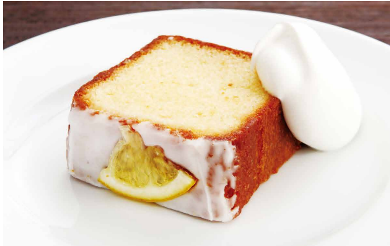
瀬戸内レモンケーキ