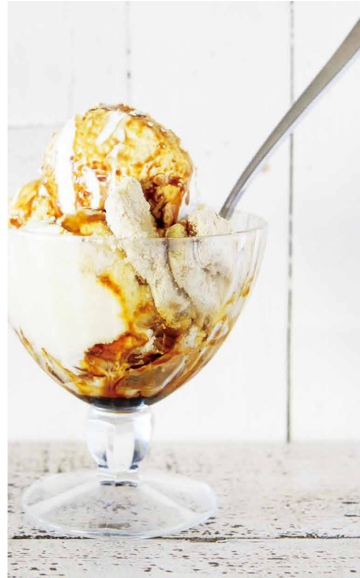
黒蜜ときなこのパフェ