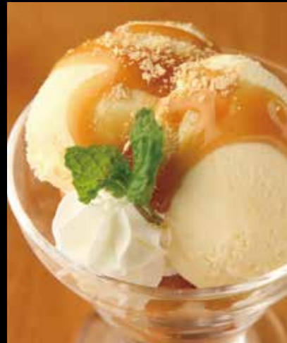
29 ハニーパフェ Honey Parfait 390