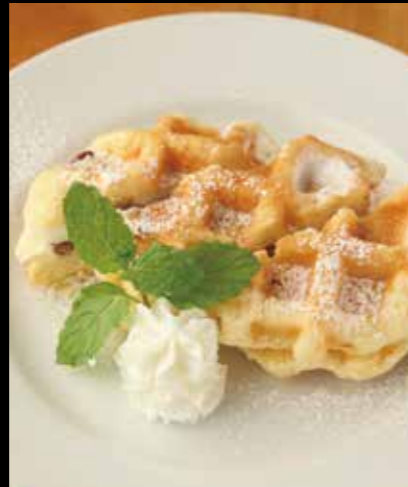
30 ワッフルサンド Waffle sandwiches 390