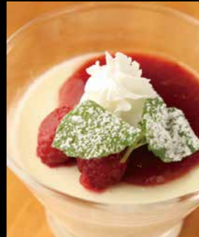
32 パンナコッタ Pannacotta 350