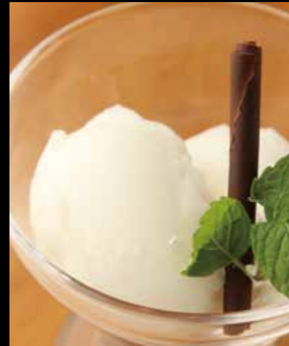
31 レモンソルベ Lemon Sorbet 290