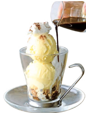
アフオガート ￥680 Affogato