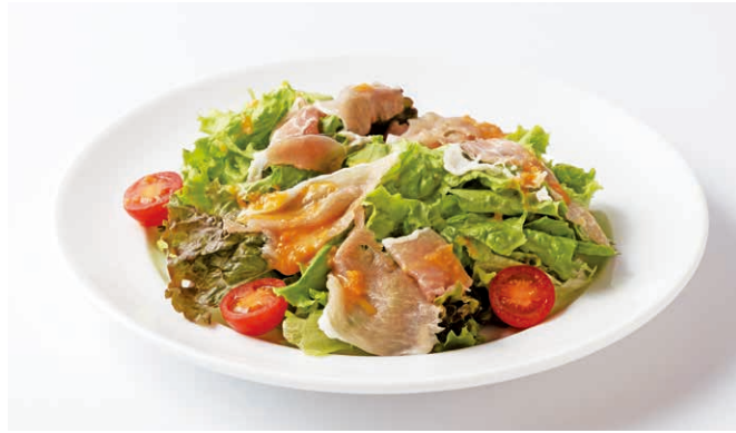
生ハムとトマトのサラダ Prosciutto and tomato salad ￥980