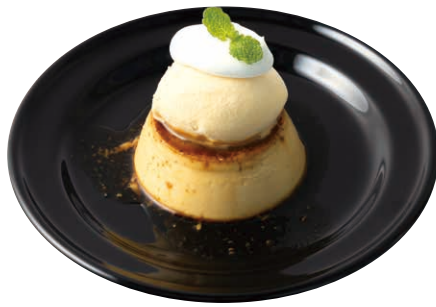
季節のプリン ￥700 Seasonal Pudding