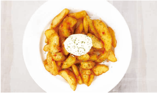
サワークリームとチリソースのディップポテトフライ Sour Cream and Chili Sauce Dip Fried Potato ￥980