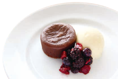
ほんのり温かい ￥980 ガトーショコラとバニラアイス Hot Chocolate Cake with Vanilla Ice Cream