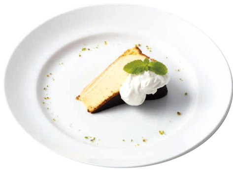
季節の バスクチーズケーキ ￥750 Seasonal Basque Cheesecake