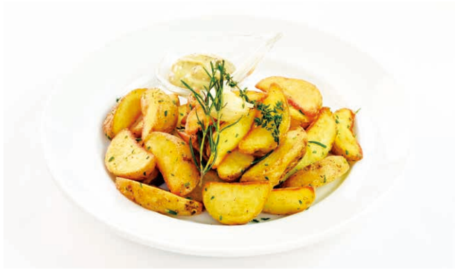
ポテトのハーブフリット 黒トリュフマヨネーズを添えて Herb Fritter with Black Truffle and Mayonnaise ￥980