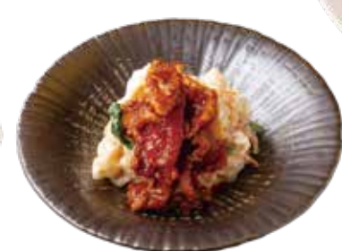
プルコギ ポテサラ ¥780