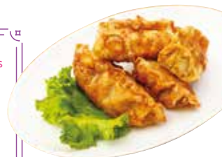
Fried Kimchi Dumplings