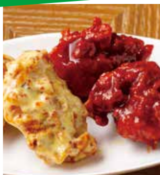
Korean Fried Chicken (Choose Half & Half)