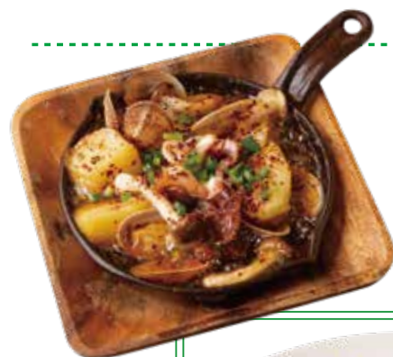
チュクミと アサリの 韓国アヒージョ ¥900