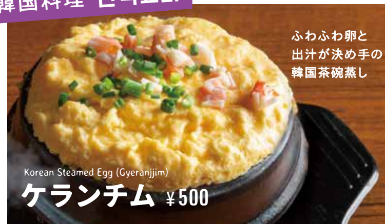
ふわふわ卵と 出汁が決め手の 韓国茶碗蒸し