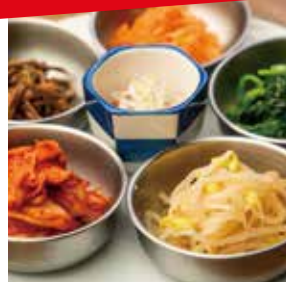
キムチと ナムル 盛り合わせ ナムル4種類、キムチ、 チャンジャの盛り合わせ ¥880