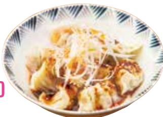
Boiled Korean Dumplings