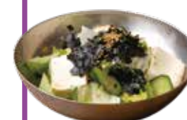
韓国チョレギ サラダ ¥480

丸腸を韓国味噌でじっくり焼上げた釜山名物 一口食べたら病みつきになること間違いなし!