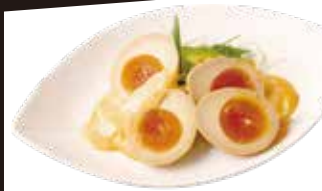
Spicy Mala Mayonnaise Egg Custard