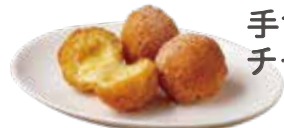
Handmade Cheese Balls