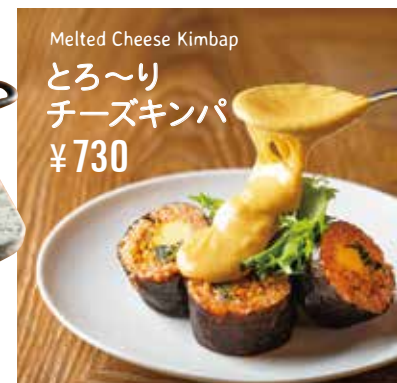
とろ〜り チーズキンパ ¥730