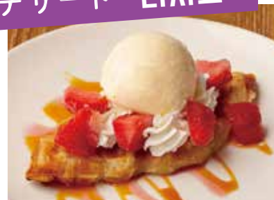
Croffle with Strawberry & Caramel Sauce