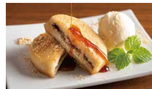
Korean Sweet Pancake (Hotteok) with Brown Sugar & Kinako