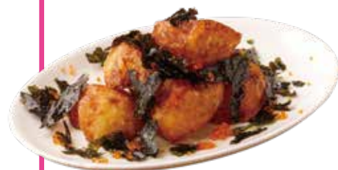
キタアカリの じゃが芋フライ 〜韓国のり&とびっこ〜 ¥600