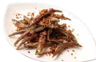
メヒカリの 旨辛揚げ ¥800