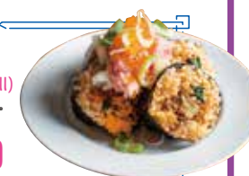
ねぎとろユッケ キンパ ¥680