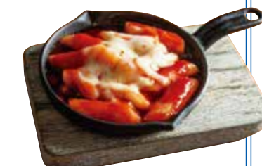
旨辛チーズ トッポギ ¥630