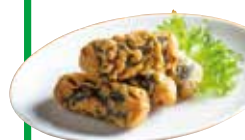
Fried Seaweed Rolls (Kimmari)