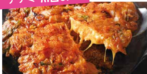
Seafood Pancake (Haemul Pajeon)