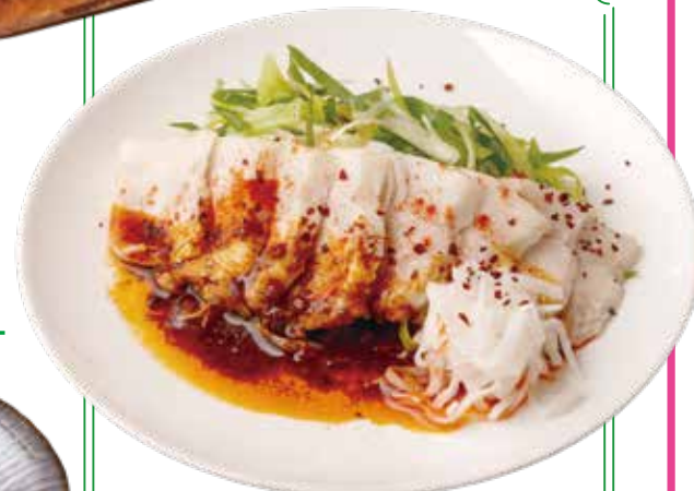
茹で豚と九条ねぎの 麻辣ポッサム ¥880