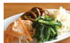
ナムル4種 盛り合わせ ¥680