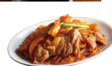
プルコギ チャプチェ ¥700