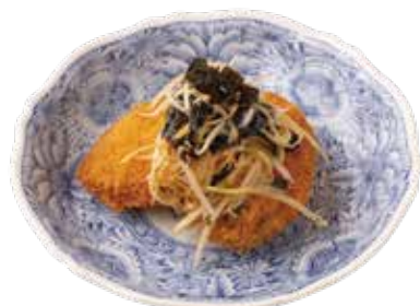
和牛メンチ 韓国のりねぎ塩ダレ ¥650