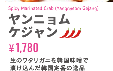
ヤンニョム ケジャン ¥1,780