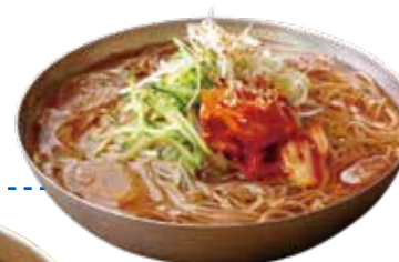
Spicy Bibim Nira-Tama Ramen