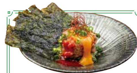
ねぎとろ ヤンニョムユッケ ¥820